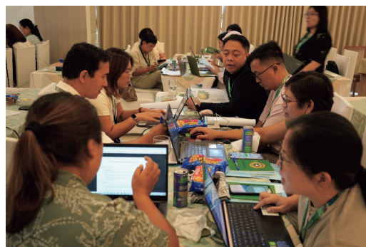
② フィリピン研修: グループワーク