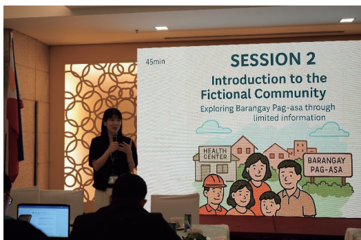
① フィリピン研修: 講義