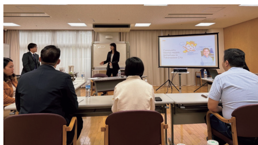
④ 本邦研修: 所沢市保健センター講義、意見交換

①は、初日の講義で架空事例を用いて、参加者がそれぞれの地域で自分の立場でできることについて考えるためのレクチャーを行っているところです。