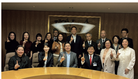
③ 本邦研修: 所沢市長表敬