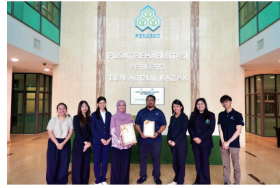
タイ保健省 マレーシア研修(Feb. 2026)