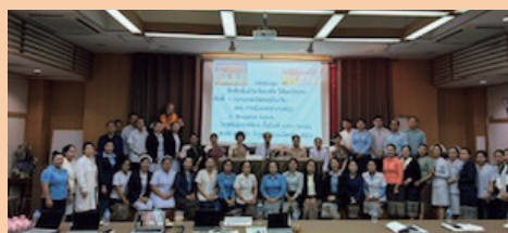
セタティラート病院 研修修了者と共に ラオス保健省広報新聞に掲載