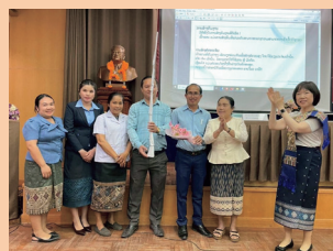
医療安全研修 チームビルディング