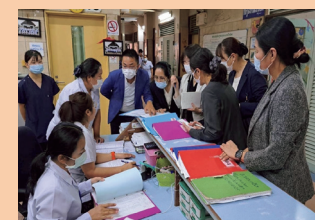
セタティラート病院 現地視察(病棟・救急外来) 課題に対する意見交換