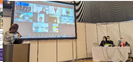
日本看護科学学会・学術集会の交流集会において、事業の展開について成果を発表