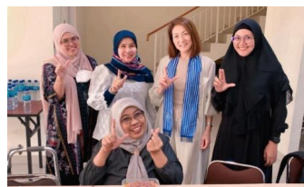
事業に関する老年看護協会IPEGERIとの会議