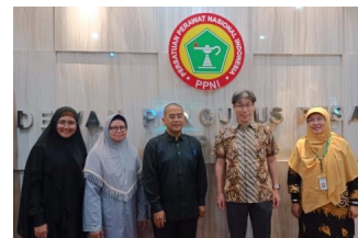
事業に関する看護師協会との会議