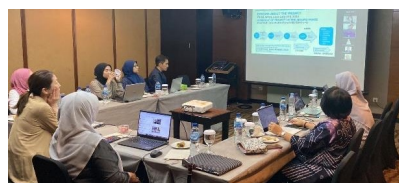
ジャカルタ市内で事業研修員とハイブリッドで開催した、保健省、看護師協会との合同会議の様子