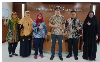
事業に関する保健省との会議