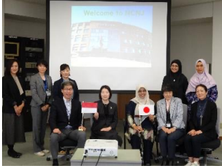
国立看護大学校への訪問と、 老年看護学実習に関する講義