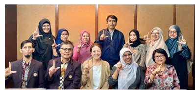
上記合同会議(対面)参加者