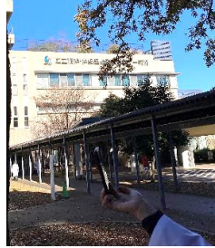
老年看護学実習の視察を行った 国立精神・神経医療研究センター