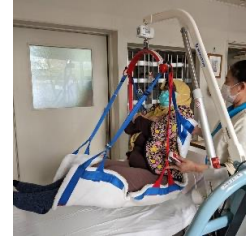
特別養護老人ホーム杏樹苑での移乗支援機器の体験