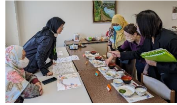
高齢者施設における食事・栄養、摂食嚥下の 支援に関する説明